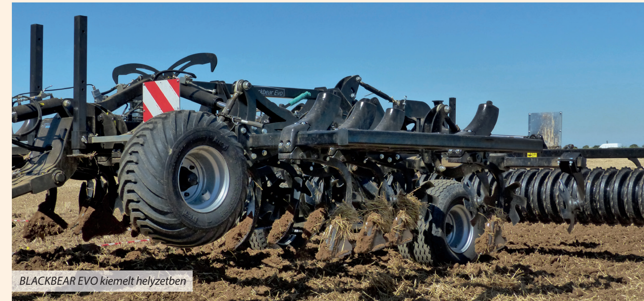
BLACKBEAR EVO kiemelt helyzetben