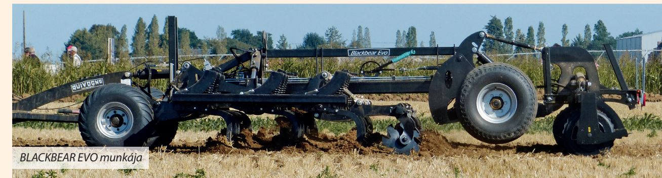
BLACKBEAR EVO munkája

Fontos: a BLACKBEAR EVO kultivátor üzemeltetéséhez a traktornak 1 db egyszeres és 2 db kettős működésű hidraulika kihelyezésre van szüksége.