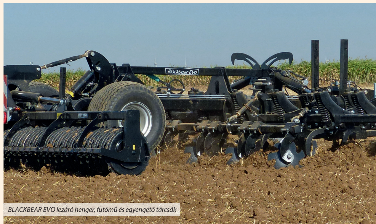
BLACKBEAR EVO lezáró henger, futómű és egyengető tárcsák