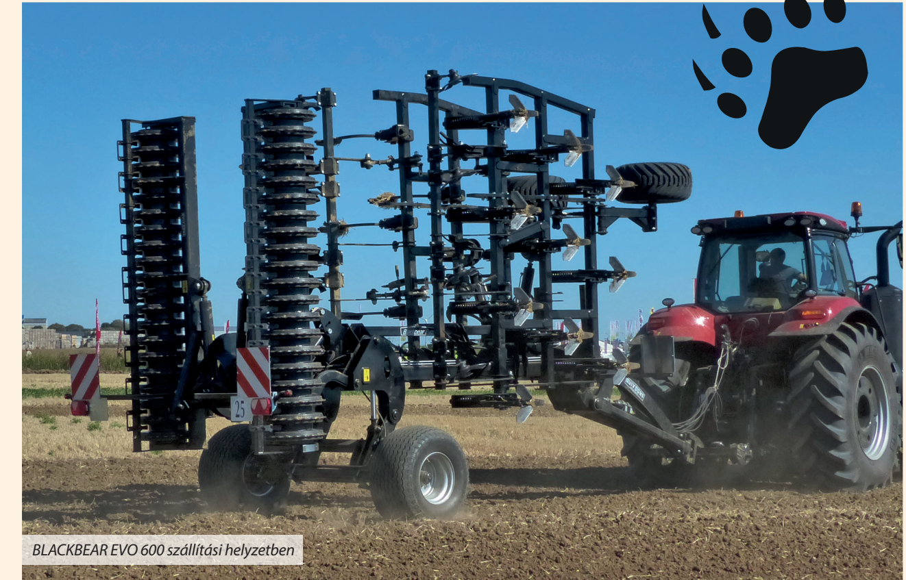
BLACKBEAR EVO 600 szállítási helyzetben