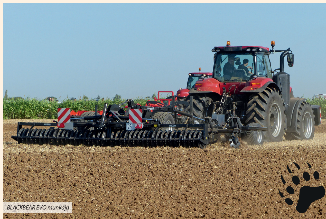
BLACKBEAR EVO munkája