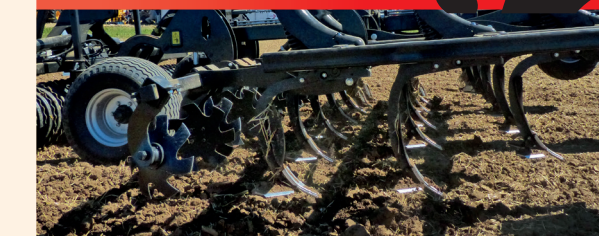
Egyengető tárcsák, kapaszekció