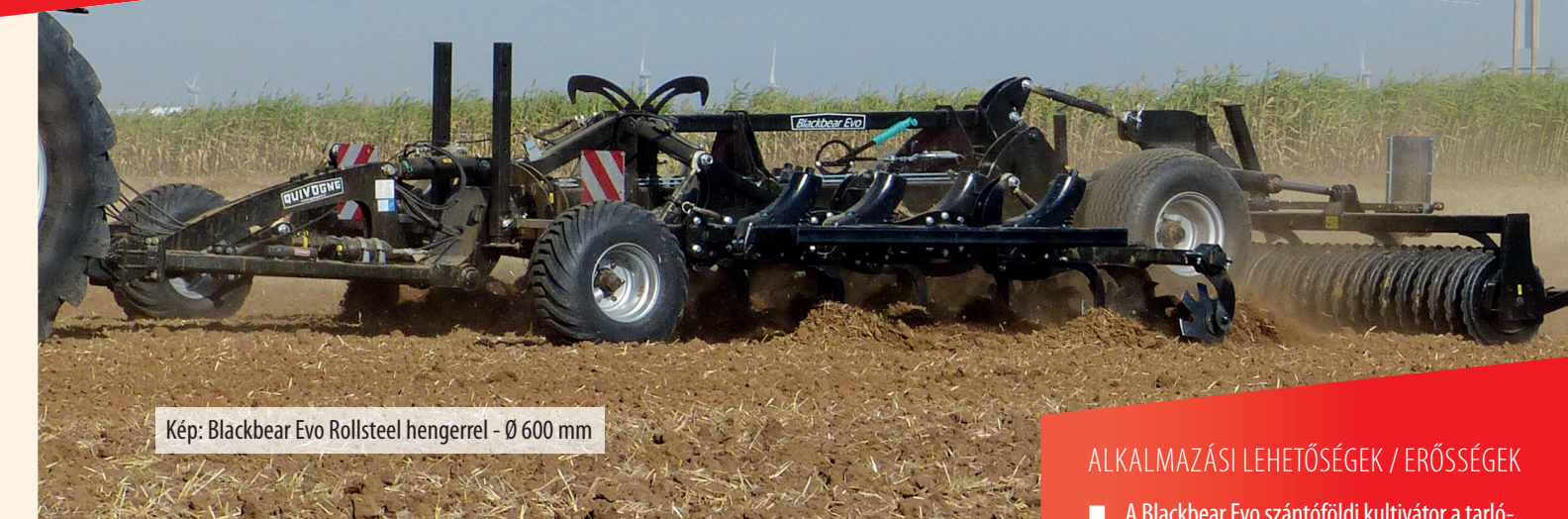
Kép: Blackbear Evo Rollsteel hengerrel - Ø 600 mm