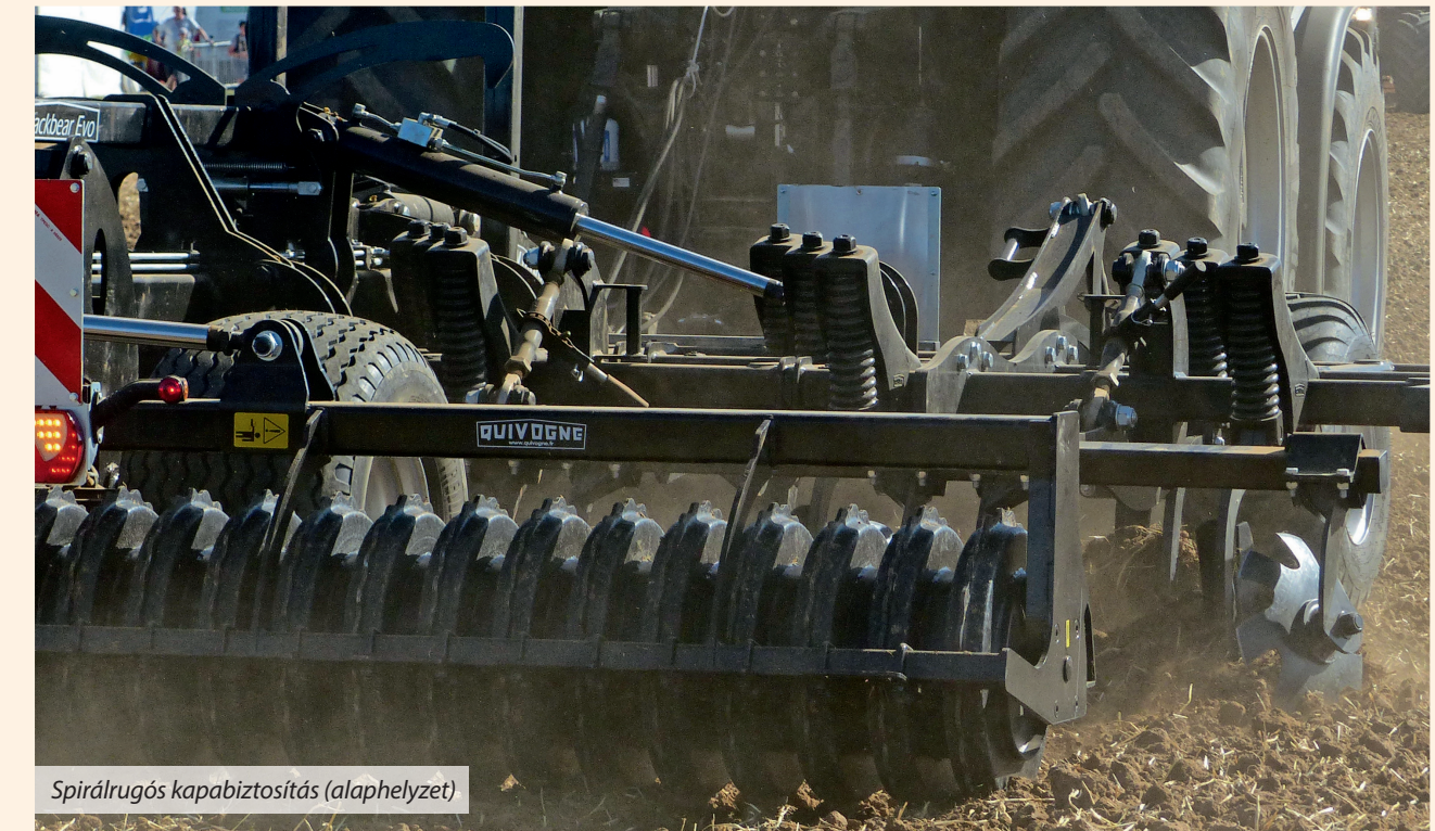
Spirálrugós kapabiztosítás (alaphelyzet)